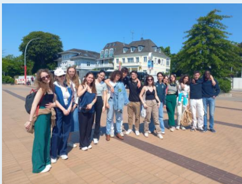
Voyage d'études de fin d'année à Hambourg